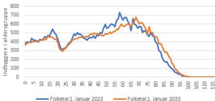
Figur 2. Aldersfordeling primo 2023 og 2033

I 2033 forventes således en forskydning henimod flere 75+-årige samtidig med, at der forventes en reduktion i antal borgere i den erhvervsaktive alder.